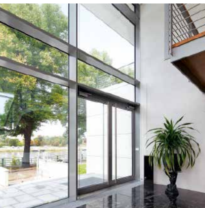
Алюминиевая дверная система Schüco ADS 65.NI Schüco Aluminium door system ADS 65.NI

Алюминиевая дверная система Aluminium Door System